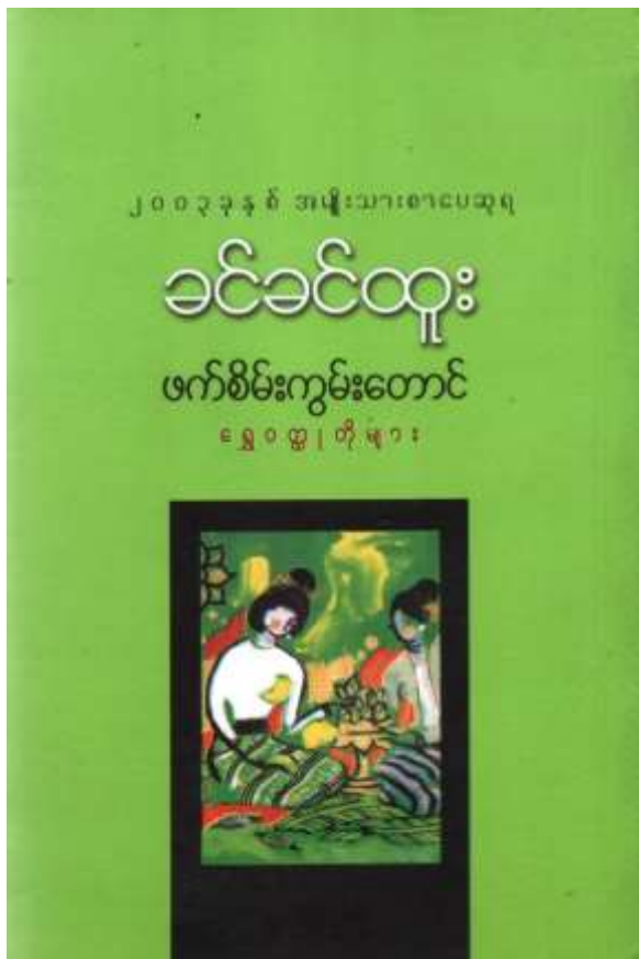
အလေ့လာခံ စာအုပ်မျက်နှာဖုံး